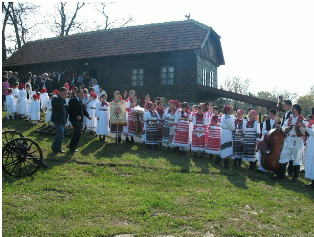
4. Zagorska hiža iz Mihovljana