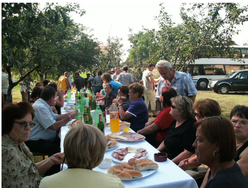
1. Druženje Zagoraca u Jarmini