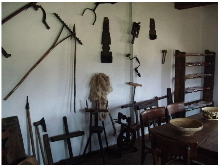
2. Unutrašnjost hiže